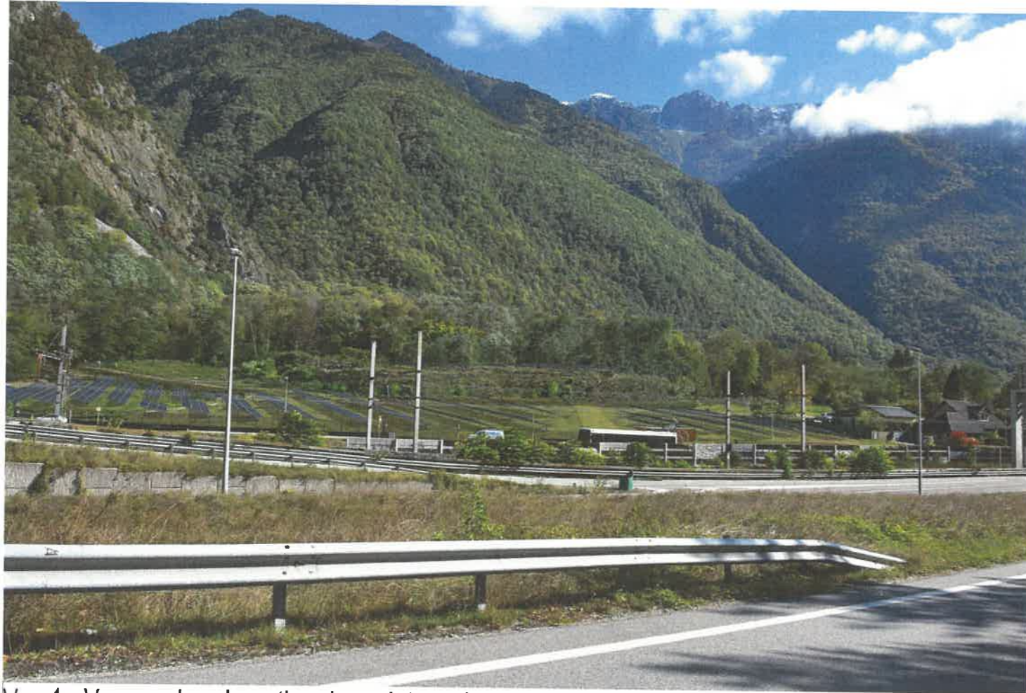
Vue 1 - Vue proche - Insertion du projet au site depuis la voie d'insertion Sans végétation